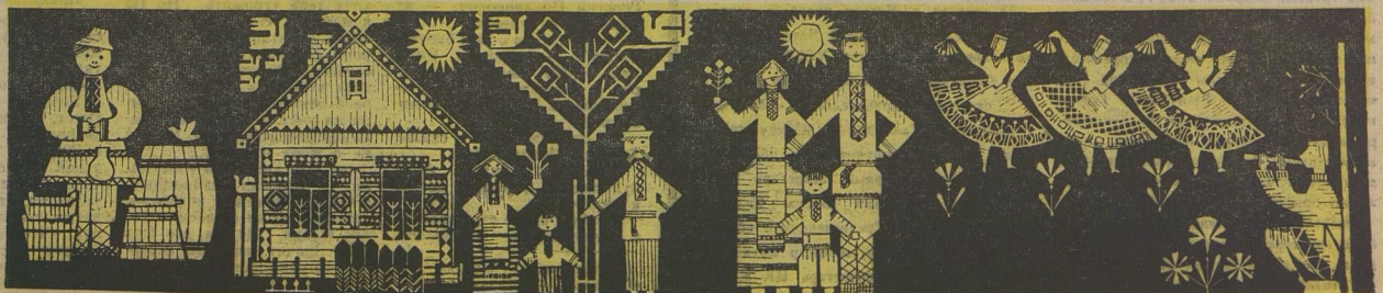
Аппликация из соломы, которые вы видите на снимке, сделаны руками народных умельцев на Жлобинской фабрике в Белорусской ССР.

Ахат хлопнул было в ладоши, чтобы разбудить Фариду, но Рахимян остановил его: