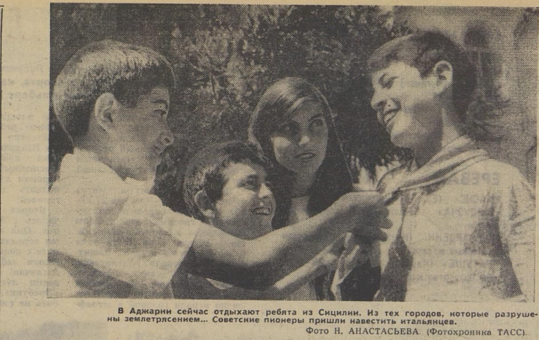
В Адриатики сейчас отдыхают ребята из Сицилии. Из тех городов, которые разрушены землетрясением... Советские пионеры пришли навестить итальянцев.

Ничего особого, — сказал Карпов, — ответь, пожалуйста, только на один вопрос: кто был с тобой? Я, со своей стороны, даю слово, что не выдам тебя... — Я не знаю, — упрямо сказал Илья. — Молодцом! — мелькнуло у Одика. — А может, это совсем не Илья?» — Занятно! — усмехнулся Георгий Никанорович. — Налетели, потоптали, помяли всё, выбили стекло, и ты никого не знаешь? Илья молчал. — Ну хорошо, подумай ещё. Я буду держать тебя здесь, пока родители не хватятся и не обратятся в милицию, и тогда... Услышав сзади шепсел и хруст, Одик вздрогнул и обернулся. Пелагея позвала в грядках клубники с корзинкой и обрывала ветви. Одик зашёл за угол сарая и услышал, как проскрежетала дверь, из сарая вышел Карпов. «Что делать?» Одик быстрее скользнул в дверь и шепнул сквозь щель: — Это ты, Илья? — Я, — раздалось у сарая. Одик коснулся пальцами замка. Дужка вышла из замка. «Что делать? Отпустить?» Одик оглянулся. Вот-вот появится Карпов! Что же ты? — раздался шёпот из за дверей. — Вот тебе рубль. Держи! — Одик увидел, как снова узкую щель просунулась желтая бумажка. — Просту тебя как друга, выручи... Одика бросило в жар. И вдруг странная злость захлестнула его. — Так тебе и надо! — бросил он. — Будешь знать,